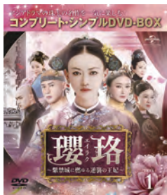
『瓔珞〜禁城に燃ゆる逆襲の王妃〜』コンプリート・シンプル DVD-BOX 1-5 各5,500円(税込) 発売元:NBCユニバーサル・エンターテイメント (C)2018 Dongyanghuanyu Film & Television Culture Co., Ltd. All Rights Reserved ※2022年9月の情報です。