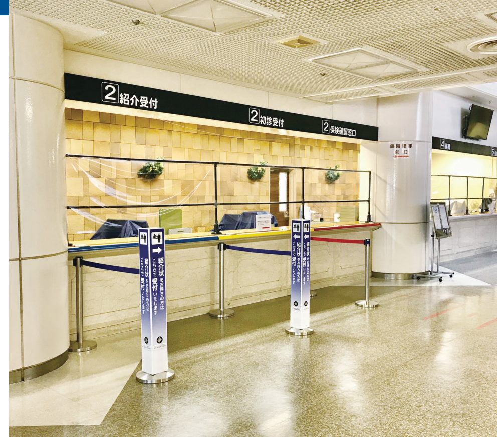
各受付の窓口にはビニールカーテンでの仕切りを行っております。