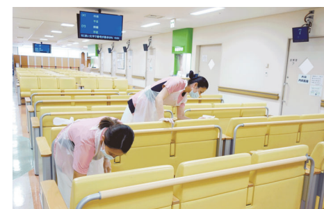
そのほか、待合スペースの椅子を消毒することをはじめ、各外来・病棟の環境清掃を強化しています。