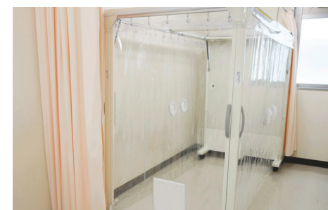
発熱されている患者様には専用の待合スペースをご用意し、別室には感染防止クリーンベッド(簡易陰圧装置)も設置しております。

当院は感染症指定病院ではありませんが、空調を特別に管理した陰圧室を、救命センター外来に1室、救命救急室に3室用意し、感染症診療を含んだ救急医療を始め、地域の医療に欠くことのできない役割を果たしています。その中で、新型コロナウイルス感染症が疑われる患者様を診察・治療することもあります。その場合は、他の患者様との接触のない空間で診察・入院加療を行い、治療にあたる職員は、毎回決められた感染予防対策を厳守することで、院内の感染予防に務めています。