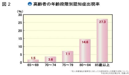
図 2(左下)認知症を有する高齢者の割合 「老人保健福祉計画策定に当たっての認知症老人の把握方法等について」平成4年2月 老計第29号、老健14号