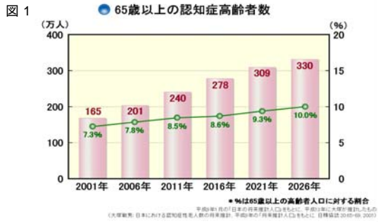
図 1(左)認知症を有する高齢者の将来推計数 %は、65歳以上の高齢者人口に対する割合 平成9年1月の「日本の将来推計人口」をもとに、平成13年に大塚が推計したもの。 (大塚敬男：日本における認知症老人数の将来推計、平成9年の「将来推計人口」をもとに 日精協誌 20:65-69,2001)